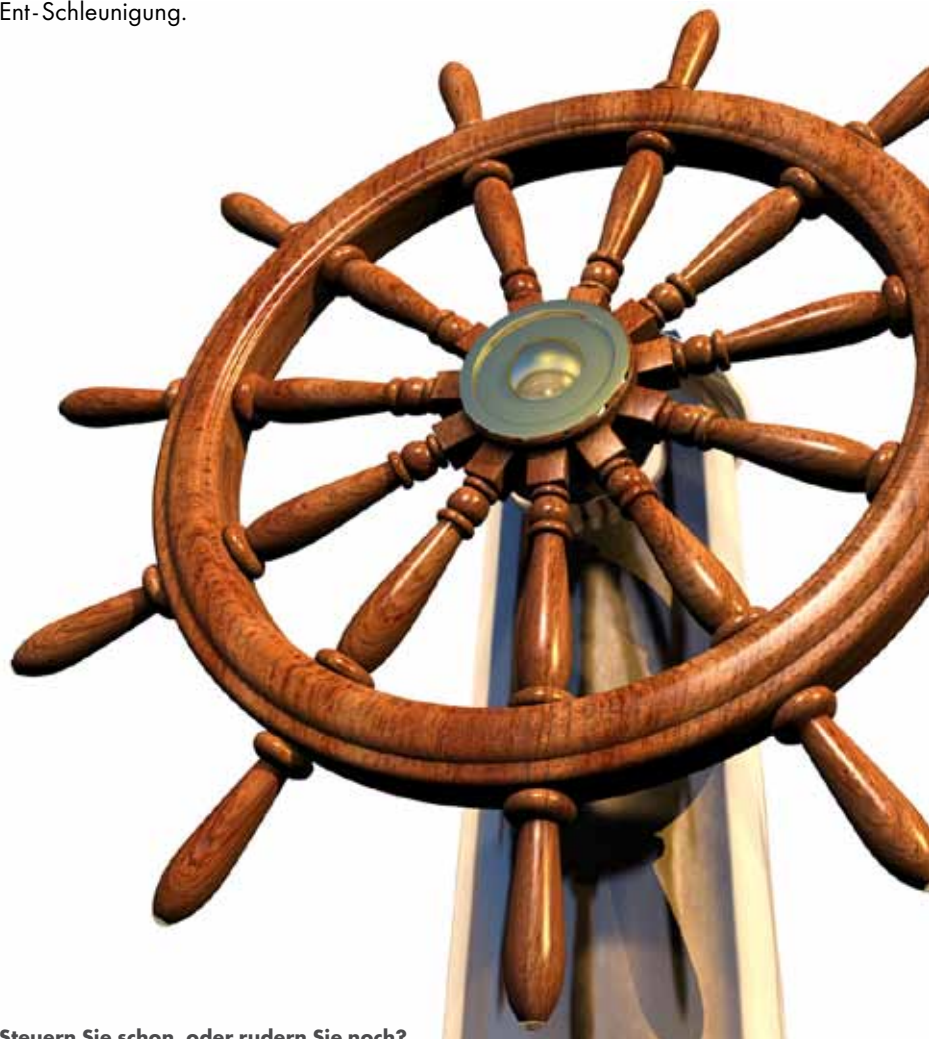
Steuern Sie schon, oder rudern Sie noch?