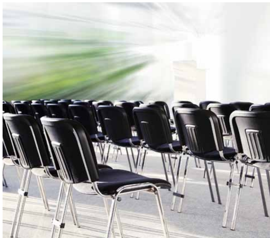
Wir sind mal eben im Werte-Café

War nun erwartet worden, dass Werte wie Verantwortung, Genauigkeit, Initiative, Respekt und Ausdauer aus der Sicht der Teilnehmenden ein Garant für die erfolgreiche Gestaltung der Abteilungsprozesse waren, der wurde zwar nicht enttäuscht, der herausragende Wert jedoch wurde in der ‚Gelassenheit‘ identifiziert. Mit ihr war es offensichtlich möglich, auch schwierigste Probleme im Personal-, Technologie- oder Marktmanagement in den Griff zu bekommen. Viele Erlebnisse konnten erinnert werden, in denen die Gelassenheit einen wichtigen Beitrag für die Bewältigung der Aufgaben geleistet hat – eine Gelassenheit, die nicht ins Lässige, Unbedarfte oder Ent-Spannte verfiel, sondern vielmehr den Wesenskern der Abteilung ausmachte.