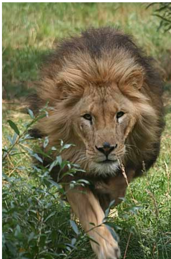
König der Gelassenheit

sich verändernde Lichtverhältnisse oder das typische Fluchtverhalten des Beutetieres, an. Ein Löwe verlässt sich dabei ohne das geringste Zögern darauf, dass sein Jagdkumpan seine Rolle kennt und erfüllt. Wie gelassen würde es uns ‚Zweibeiner‘ machen, wenn wir einander so vertrauen würden?