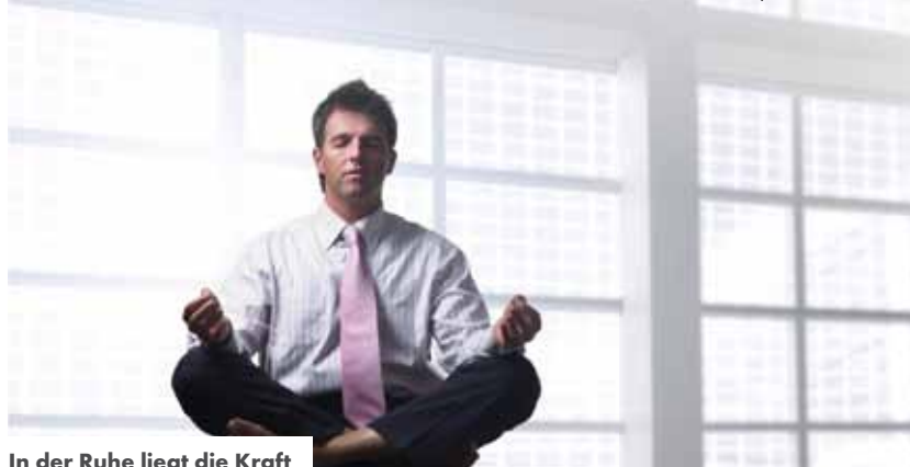
In der Ruhe liegt die Kraft

Nun praktiziere ich möglichst täglich 21 Minuten lang die Sitzübung. Das Loslassen funktioniert. Mein Geist löst sich auch im beruflichen Alltag sehr oft und sehr viel schneller von Gefühlen und Gedanken. Ein gutes Training für Gelassenheit. Denn keines meiner Gefühle und keiner meiner Gedanken hat wirklich ein Recht darauf, so stark zu wirken, dass ich nicht mehr wahrnehme, was tatsächlich oder wirklich ist. [rf]