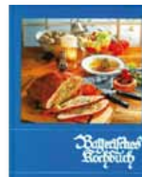
Hofmann M., Lydtin H.: Bayrisches Kochbuch Birken Verlag [1998]

Eine Flaschenpost würde ich nur dann versenden, wenn ich sie an mich selbst adressieren dürfte. Text: ...Bleib ganz gelassen...!