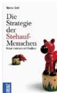
Monika Gruhl Die Strategie der Stehauf-Menschen: Krisen meistern mit Resilienz Kreuz Verlag [2010]

Was ist das Geheimnis der Menschen, die auch aus großen Krisen gestärkt hervorgehen? Wie schaffen es manche, auch größere Belastungen gelassen zu bewältigen? Sie verfügen über die zentrale Kraft im Leben: Resilienz – innere emotionale Stärke, die uns durch Krisen trägt, in Verbindung mit praktischen Fähigkeiten, auf die wir auch bei alltäglichen Herausforderungen zurückgreifen können. Eine konkrete Einführung mit vielen Fallbeispielen und Anregungen, die sofort praktisch umsetzbar sind.