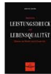
Johannes Czwalina Zwischen Leistungsdruck und Lebensqualität. Warum der Markt keine Seele hat. Co.in. Medien Verlag [2003]

können. Es erfordert viel Mut und eine klare Entscheidung für die eigenen Prioritäten im Leben, ein solches Angebot auszuschielen. Entscheiden ist immer auch mit Verzicht verbunden, jedoch kann ein Verzicht letztlich zu einer höheren Lebensqualität führen – im Privaten und auch bei der Arbeit. [sb]